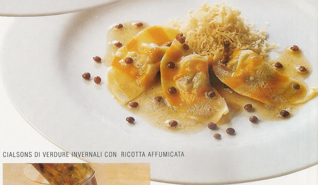
CIALSONS DI VERDURE INVERNALI CON RICOTTA AFFUMICATA

Come si compone il menu che sta preparando e che i lettori de "La Cucina Italiana" che verranno da lei, nel mese