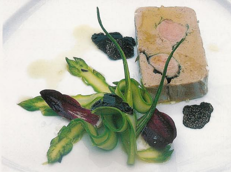
La terrina di agnello con asparagi e tartufo nero. Sotto, i tortelli di carciofi al ragù di agnello. Sono entrambe ricette che si possono provare al ristorante La Primula di San Quirino (Pordenone)