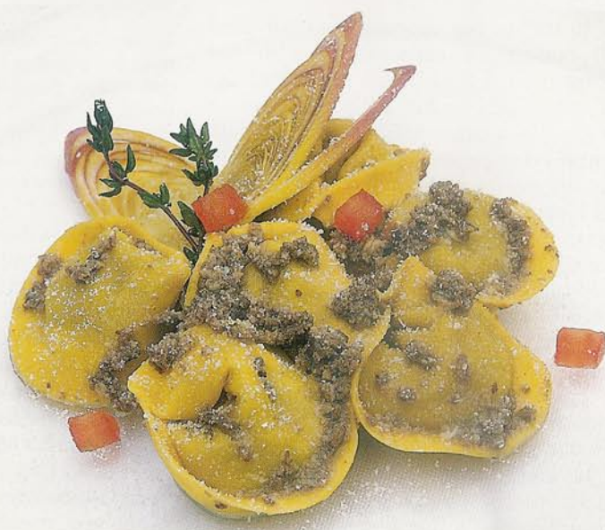
Ecco una carrollata con alcune delle parti più prelibate dell'agnello: costine, coscia, spalla e la punta di petto